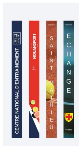
Ex : Décors personnalisés