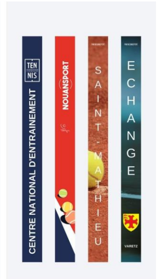
Ex : Décors personnalisés