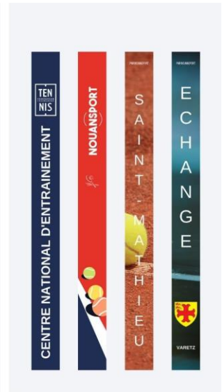
Ex : Décors personnalisés